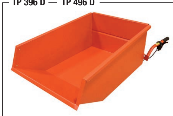
TP 396 D — TP 496 D