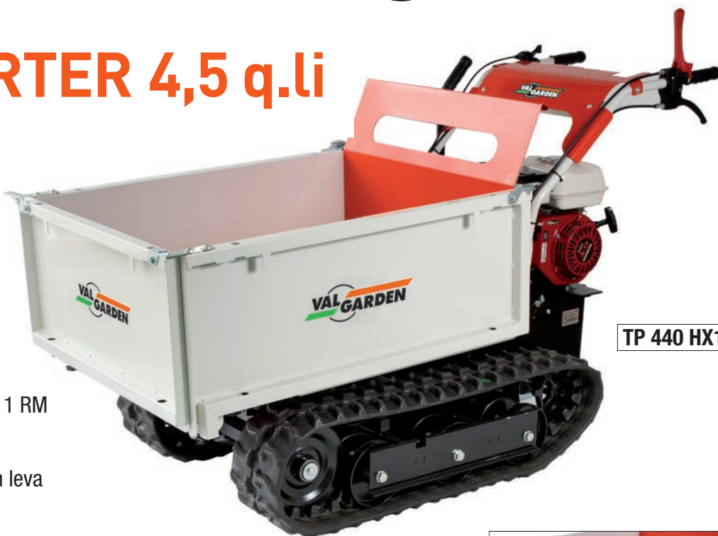
TP 440 HX1

Transporter cingolato Motore Honda 4T OHV GX-160 Cilindrata 168 cc - HP 5,5 circa Portata 450 kg Modello Professionale con molle di compensazione del tendi-cingolo Cambio meccanico 3 vel. avanti + 1 RM Cassone standard cm 85 x 69 Sponde allargabili altezza 40 cm Sollevamento pianale manuale con leva Peso macchina 195 kg