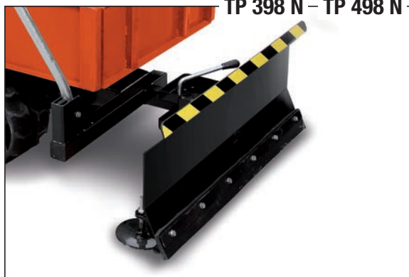
TP 398 N — TP 498 N